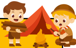
MINI CAMP : Ma nuit découverte (GS) 2 jours et 1 nuit

Au programme Activités nature Piscine Grands jeux Veillées