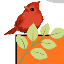
MINI CAMP : Grands jeux (CP - CE1) 3 jours et 2 nuits

Déduction Bons vacances CAF nuitée de 0 à 800€ : 6€ - 5,50€ - 5€